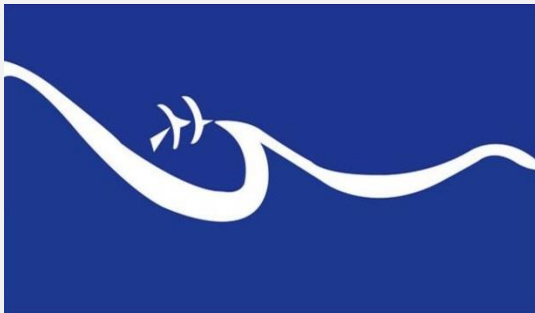
Conferencia Regional sobre Migración