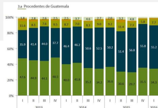
Distribución porcentual de los flujos de personas migrantes procedentes de Guatemala y de México-EUA, según principales departamentos de origen

De enero a marzo de 2016, Huehuetenango y San Marcos continuaron siendo los principales departamentos de origen de los flujos de personas migrantes procedentes de Guatemala y de México-