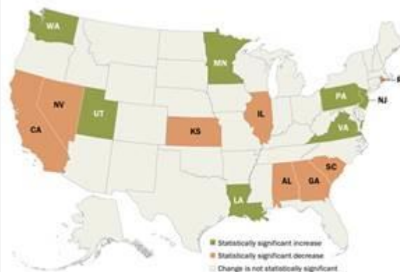
Estimated unauthorized immigrant workforce declined in eight states, grew in seven from 2009 to 2014

Note: Changes based on 95% confidence interval. The number of unauthorized immigrants in the labor force may have changed in addition to these changes, but they were not statistically significant for these estimates. Note: U.S. Unauthorized Immigrant Workforce Stable After the Great Recession