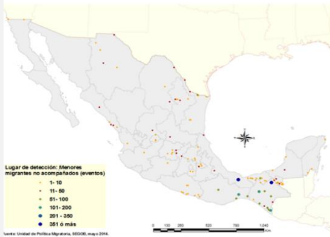
Mapa 1. Eventos de menores migrantes no acompañados detectados por el Instituto Nacional de Migración, 2014