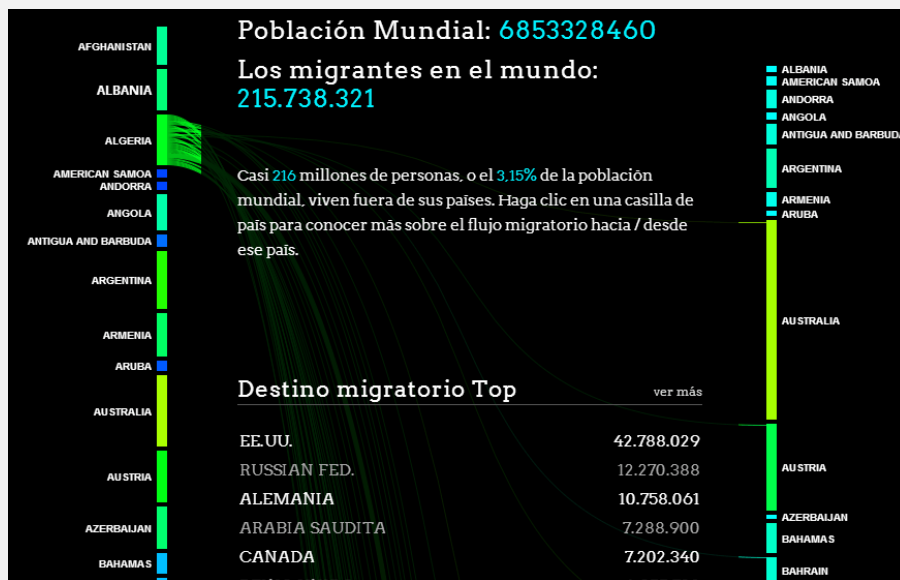
proyecto que toma los datos del Banco Mundial y los presenta en un diagrama de flujo que conectan dos columnas, la izquierda muestra los países de emigrantes y la derecha los países destino, a través de un gráfico interactivo creado por Carlo Zapponi que nos muestra los flujos de migración en el mundo. Exactamente, existen unos 216 millones de población emigrada, lo cual representa un significativo 3,15 % de la población mundial.