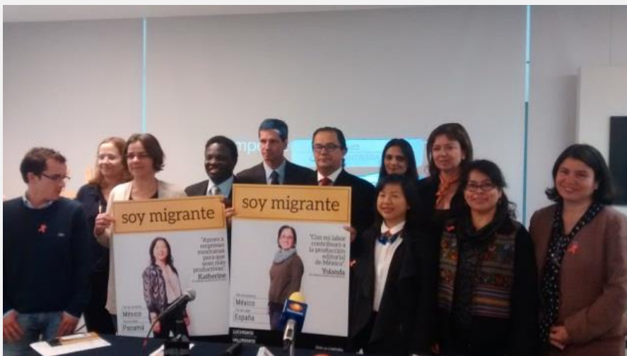
Participantes que aparecen en la campaña soymigrante . ¡Continuemos cambiando juntos el estereotipo de las personas migrantes en México!

La migración internacional ha crecido de manera notable desde el comienzo de este siglo y se calcula que en la actualidad unos 232 millones de personas buscan en países distintos al suyo nuevas oportunidades de mejorar su vida y desarrollar sus conocimientos. Alrededor de la mitad de ese colectivo son mujeres.