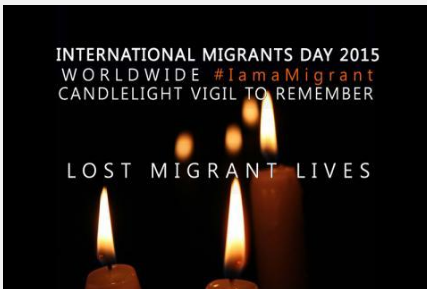
Día Internacional del Migrante 2015: vigilia mundial con velas #IamaMigrant para recordar a los migrantes fallecidos