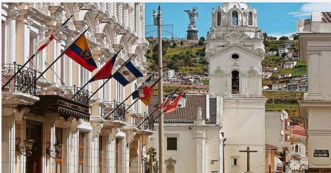
Imagen: Cortesía <pixabay.com>

Dicho Foro fue creado en 2006 y reúne a los Estados miembros, las organizaciones internacionales especializadas en temas de migración y desarrollo, así como representantes de la sociedad civil y del sector privado.