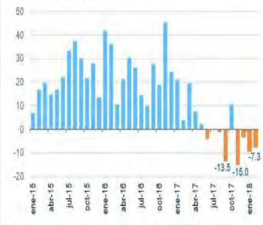
Gráfica 2. Remesas reales en pesos (Var. % anual en pesos reales)