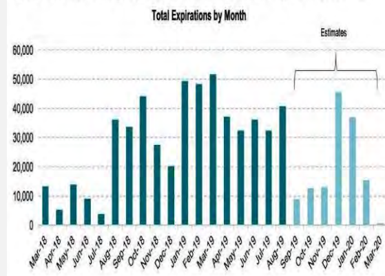
Figure 1. Predicted DACA Expirations from March 2018 through March 2020