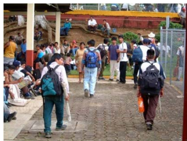
Proceso de documentación de trabajadores agrícolas en Cd. Hidalgo, Chis.