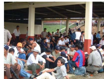
Proceso de documentación de trabajadores agrícolas en Cd. Hidalgo, Chis.