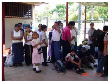
Proceso de documentación de trabajadores agrícolas en Cd. Hidalgo, Chis.